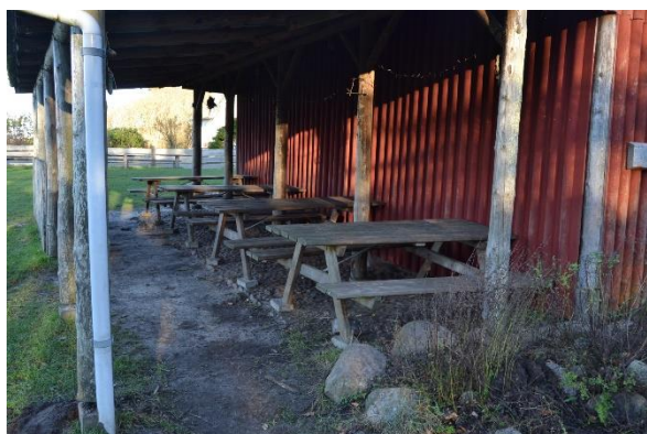
Redskab: Bord bænke set Ikke omfattet af DS/EN 1176 Emne 5: