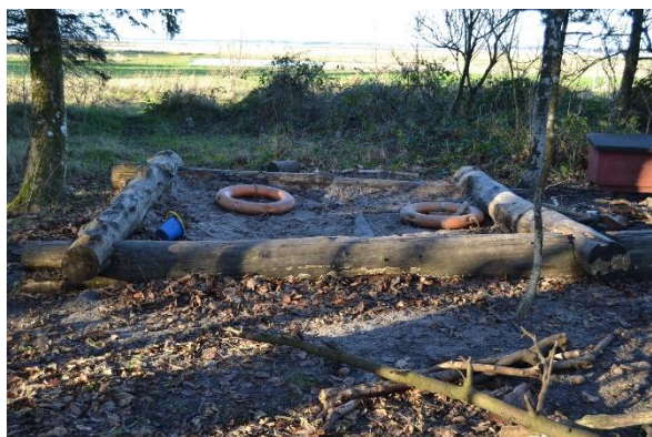
Redskab: Sandkasse Årgang: Producent: Er redskabet mærket: Nej Emne 3: Er der registreret fejl / mangler: Ja