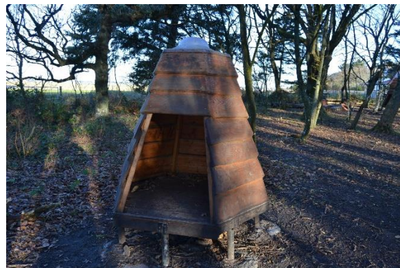
Redskab: Legehus Årgang: Producent: Er redskabet mærket: Nej Emne 2: Er der registreret fejl / mangler: Ja