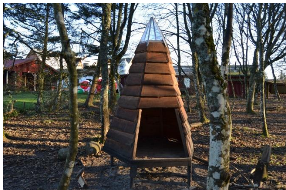
Redskab: Legehus Årgang: Producent: Er redskabet mærket: Nej Emne 1: Er der registreret fejl / mangler: Ja