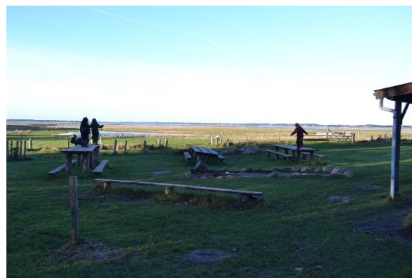
Redskab: Bord bænke set og bålplads Ikke omfattet af DS/EN 1176 Emne 4: