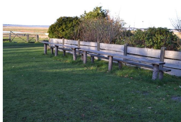
Redskab: Bord bænke set Ikke omfattet af DS/EN 1176 Emne 6: